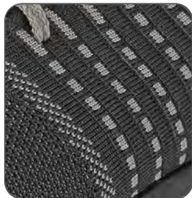
svršek z odolného polyesteru odolný polyesterový zvršok resistant polyester upper cholewka z wytrzymałego poliestru