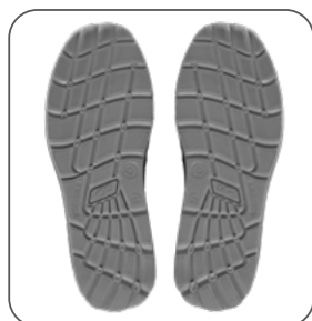
podešev podložka outsole podeszwa