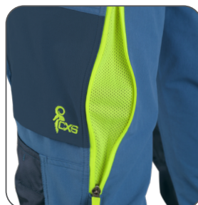
ventilace na stehně thigh ventilation wentylacja na nogawce