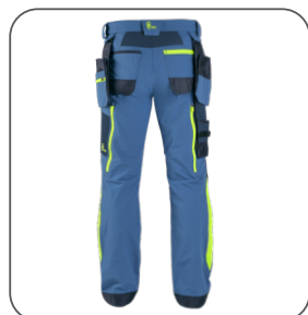
zadní strana back side z tyłu