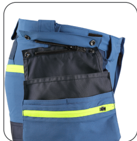
odepínací kapsy detachable pockets odpinane kieszenie